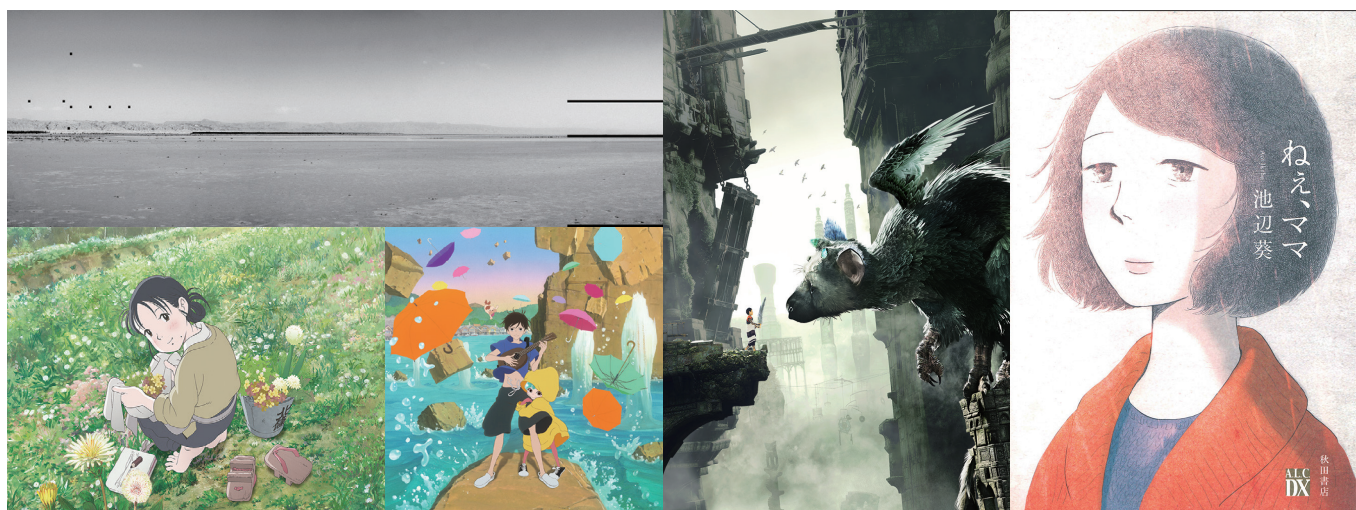
(上) © Haythem Zakaria (下左) © Fumiyo Kouno/Futabasha/Konosekai no katasumini Project (下右) © 2017 Lu Film partners

本展では、アート、エンターテインメント、アニメーション、マンガの4部門に応募された4,192作品(過去最高世界98の国と地域からの応募)の中から厳正な審査を経て選ばれた全受賞作品と、功労賞受賞者の功績等を紹介します。優れたメディア芸術作品の数々と、国内外の多彩なクリエイターやアーティストが集う様々な関連イベントを通じて、メディア芸術の“時代(いま)”を映し出します。