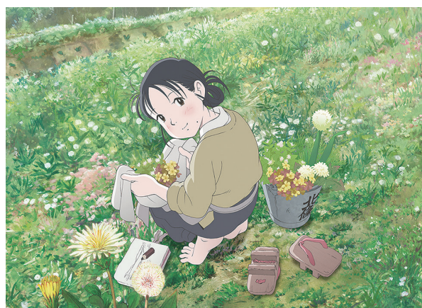
© Fumiyo Kouno/Futabasha/Konosekai no katasumini Project