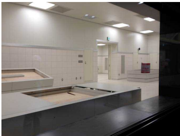
展示室から壁画保管室をのぞむ