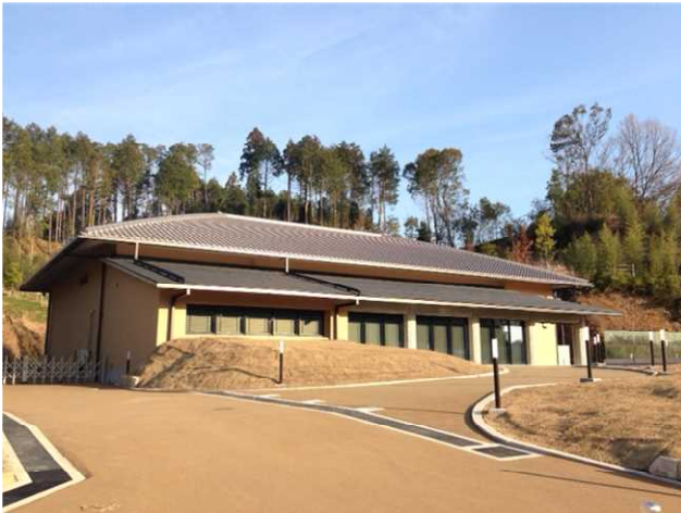
保存管理施設外観

平成28年度には、キトラ古墳壁画等の文化財の移動を行い、同年秋には本格運用を開始する予定。