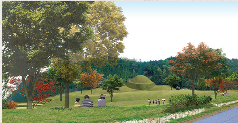
●復元キトラ古墳が見える《古墳鑑賞広場》

現在、石舞台、甘樫丘、祝戸、高松塚周辺の4地区が開園していますが、平成28年度秋に5番目の地区としてキトラ古墳周辺地区がオープンします。国営飛鳥歴史公園キトラ古墳周辺地区は、キトラ古墳を周辺の自然環境や田園景観とあわせ一体的に保全し、多くの方に飛鳥の歴史や風土、文化を楽しんで頂くために整備した13.8ヘクタールにおよぶ公園です。