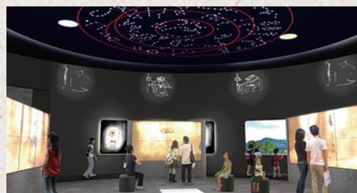
●大迫力で古墳壁画の世界にひたれる《4面マルチ高精細映像》