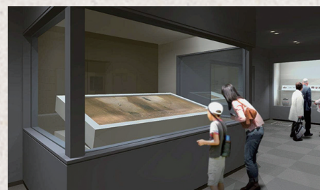
●期間限定で公開《キトラ古墳壁画実物》

キトラ古墳壁画は、石室内に塗った漆喰の上に繊細な筆づかいで描かれたものです。東アジアでも最古に属する現存例といわれる天文図や、方角をつかさどる四神の全て、動物の頭と人間の体を持った十二支などが確認されている、学術上、価値の高い文化財です。