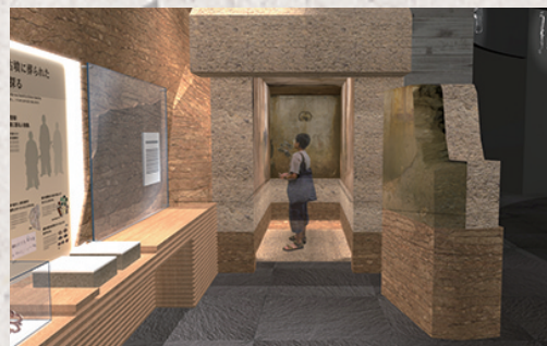
●原寸大で再現した《キトラ古墳石室模型》

キトラ古墳壁画は、石室内に塗った漆喰の上に繊細な筆づかいで描かれたものです。東アジアでも最古に属する現存例といわれる天文図や、方角をつかさどる四神の全て、動物の頭と人間の体を持った十二支などが確認されている、学術上、価値の高い文化財です。