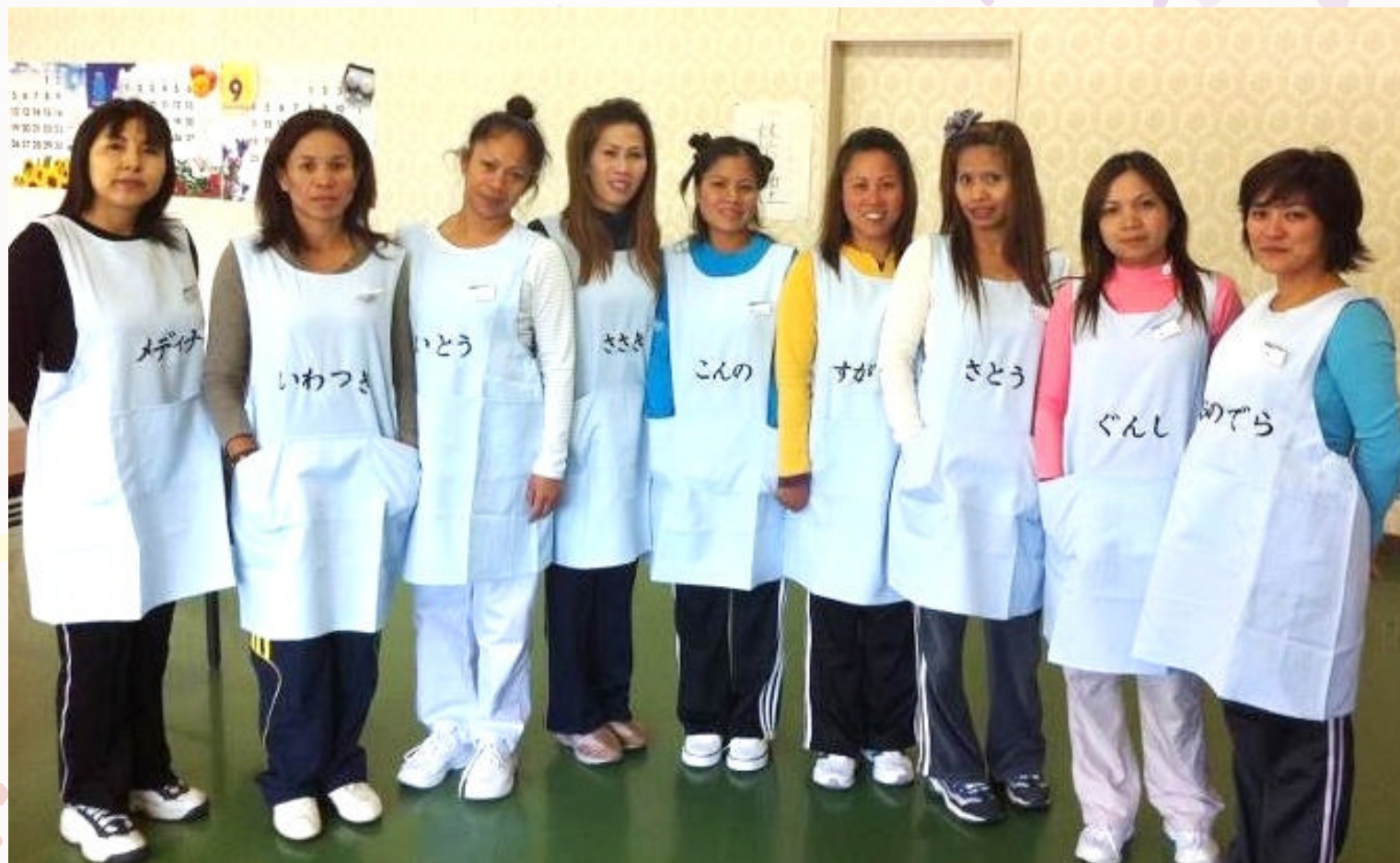
1グループのフィリピンとチリのみんな